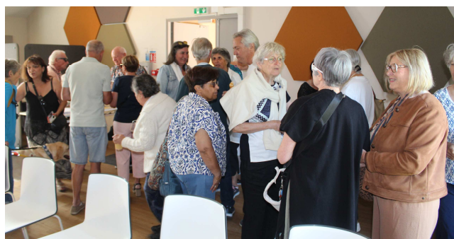
2026 : le traditionnel accueil/échanges autour de café et viennoiseries