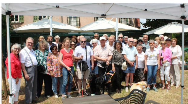
2025 : après le repas