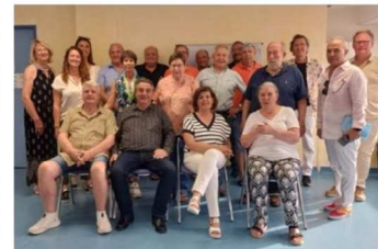
Le Lions club Hyères-les-Palmiers a remis un chèque à huit associations.

Les Boutchou de l'espoir , existant depuis trente ans, ont reçu 300 euros qui permettront d'acheter du lait et des couches pour les bébés. Les 1 000 euros pour le Lions Handivoile , club filleul du Lions, serviront à l'entretien des deux bateaux basés, l'un à l'hôpital Renée-Sabran et l'autre à la base