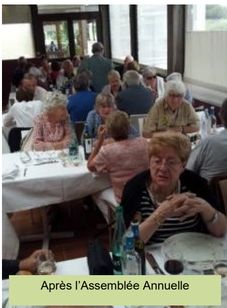
Après l'Assemblée Annuelle

- Durant les permanences, la BS a remis 682 CD en MP3 et 1047 ont été copiés sur carte SD. La BS a expédié en franchise postale 836 CD. Au total, 2565 audiolivres et 456 audiorevues.